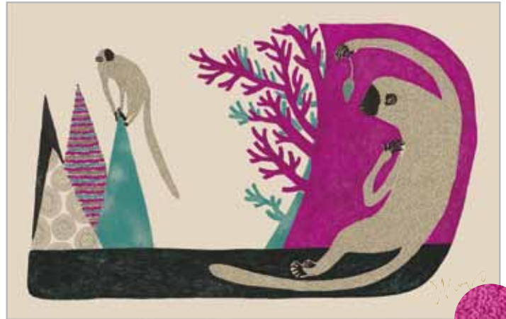
1-67962-21-PAP TTC-moritaMiW サル 「好奇心」