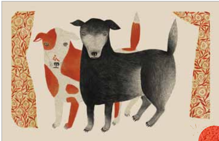
1-67963-21-R TTC-moritaMiW イヌ 「黒犬チョークと赤斑犬のテン」裏パイル/レッド