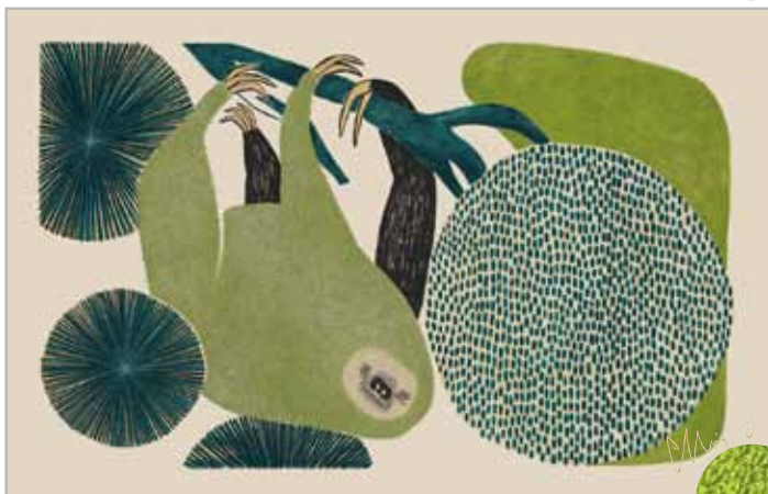
1-67965-21-G TTC-moritaMiW ナマケモノ 「ナマケルというお仕事」裏パイル/グリーン