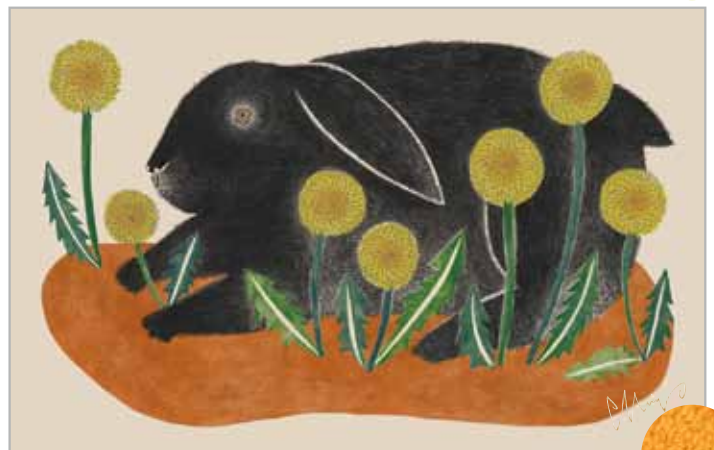
1-67966-21-OR TTC-moritaMiW ウサギ 「シアワセな黒兎」