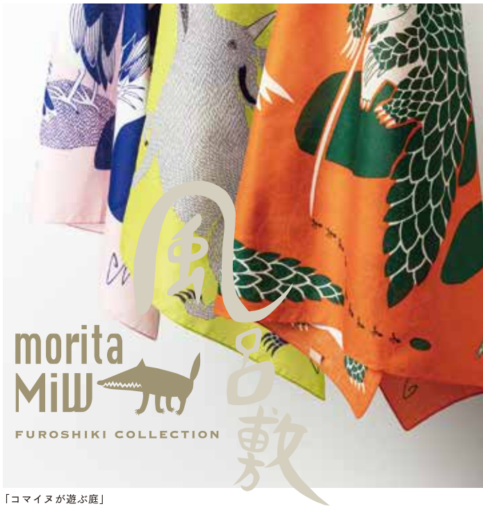
「コマイヌが遊ぶ庭」