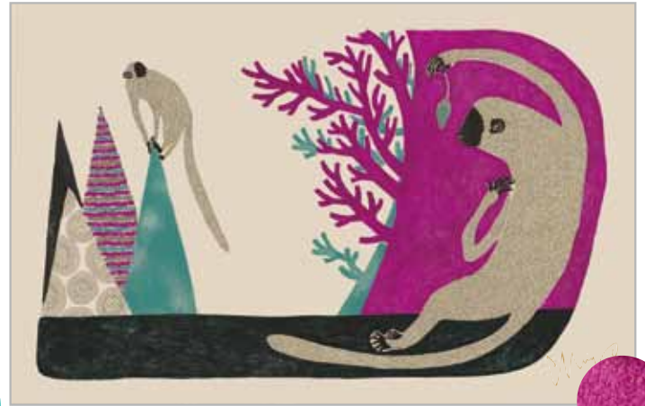
1-67962-21-PAP TTC-moritaMiW サル 「好奇心」