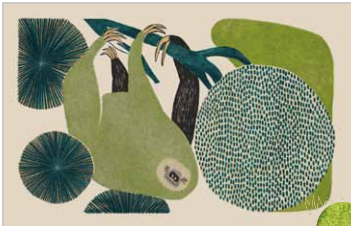
1-67965-21-G TTC-moritaMiW ナマケモノ「ナマケルというお仕事」裏パイル/グリーン