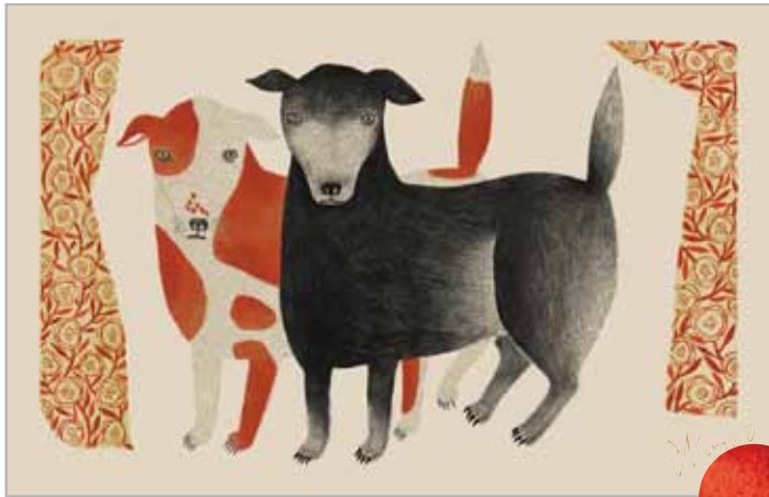
1-67963-21-R TTC-moritaMiW イヌ「黒犬チョークと赤斑犬のデン」裏パイル/レッド