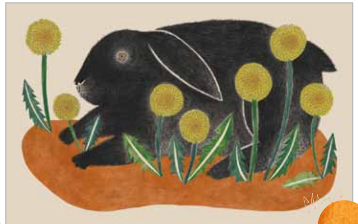
1-67966-21-OR TTC-moritaMiW ウサギ「シアワセな黒兎」