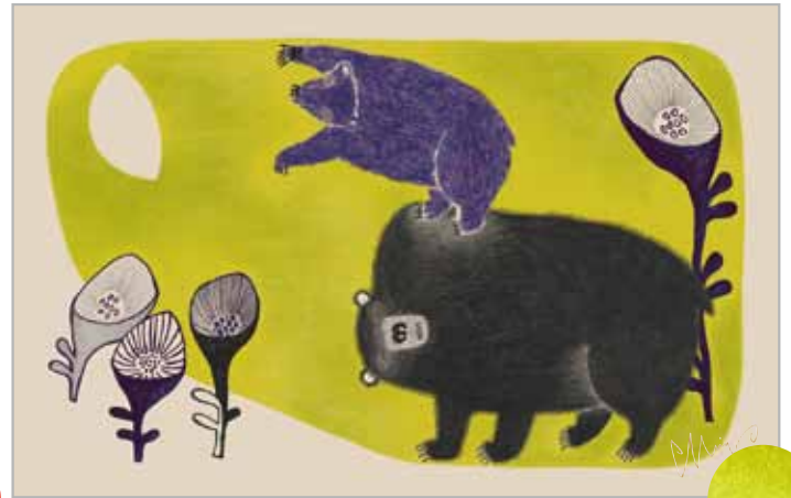
1-67964-21-Y TTC-moritaMiW クマ 「檸檬みたいな月」